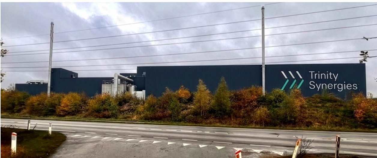
Visualisering umiddelbart ud for projektområdet – set fra nord mod syd. Indkigget er i forvejen påvirket af det gennemgående højspændingstracé.

Selv om landskabets karakterer med projektet får tilføjet en øget teknisk påvirkning, vurderes det kun ubetydeligt i det allerede teknisk prægede landskab.