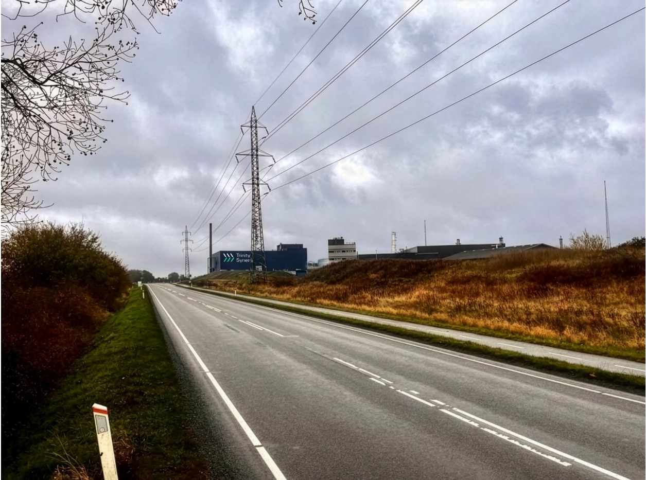
Visualiseringen i umiddelbar nærhed til Lokalplanområdet – set fra vest mod øst. Synligheden af projektet er mindre. Indkigget er i forvejen påvirket af det gennemgående højspændingstracé og eksisterende industri.