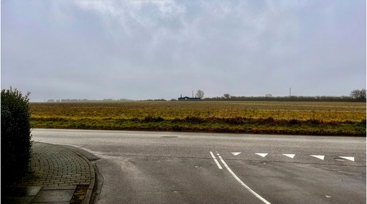
Visualisering fra beboelsesområdet ved Egeskov Bygade ca. 1 km nord for Lokalplanområdet.