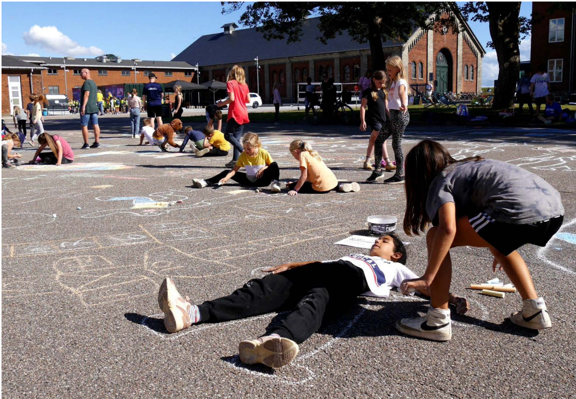
Udgivet af Fredericia Kommune Tekst/redaktion: Kulturkaserneudvalget Illustrationer: Jørgen Serup, Ejendomsafd. Fredericia Kommune