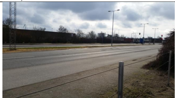
Svidning, men også grønt græs i midterrabbatten på Strandvejen (7. marts 2016)