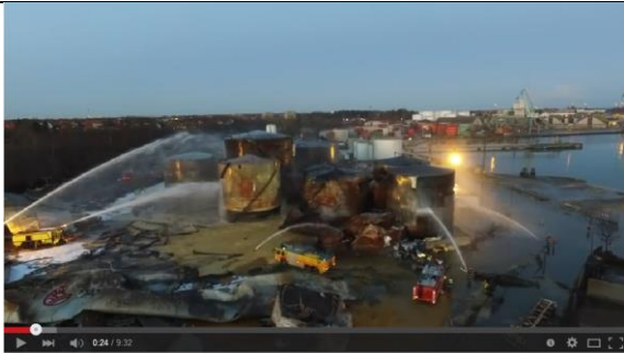
Droner: Brand på Fredericia Havn