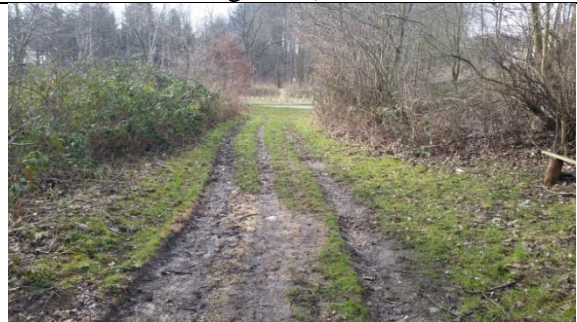
Ingen tegn på svidning hvor stien bag Autohuset Vestergaard ender i Vestre Ringvej. (7. marts 2016)