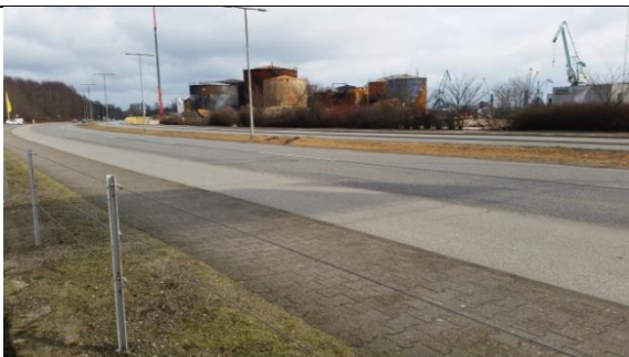
Svidning i midterrabbatten på Strandvejen. (7. marts 2016)