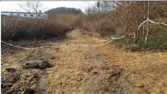
Svidning af vegetationen på stien bag Autohuset Vestergaard (7. marts 2016)