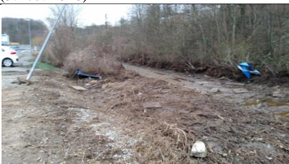
Ubefæstet areal – offentlig sti bag Autohuset Vestergaard. (7. feb 2016)