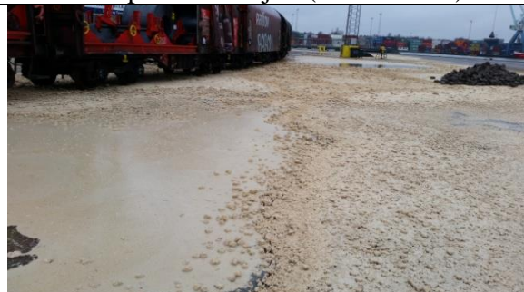
Palmeolie på Pakhusvej (5. feb. 2016)