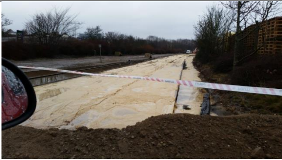
Ubefæstet areal: Jernbanearealet parallelt med Strandvejen. (9. feb. 2016)