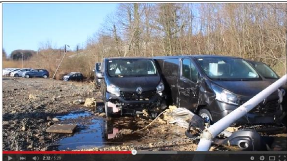
03-04/02-2016 Voldsom brand i silo, Fredericia

Beredskabsstyrelsens droneoptagelser viser med al tydelighed, hvordan området mellem tankanlægget og kajarealet er væskefyldt. Det gule i tankområdet er spild fra Nagro A/S tanke.