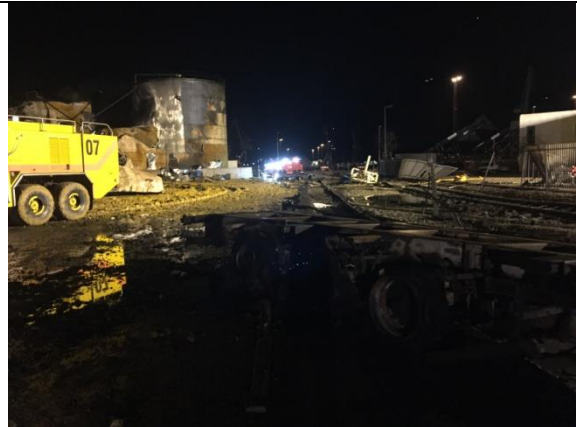
Skadestedet (4. feb. 2016)