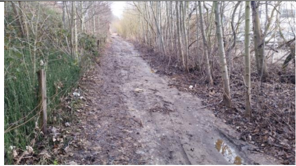
Offentlig sti bag Autohuset Vestergaard, set fra syd mod nord, terrænet skråner svagt i retning af Autohuset Vestergaard (7. marts 2016)