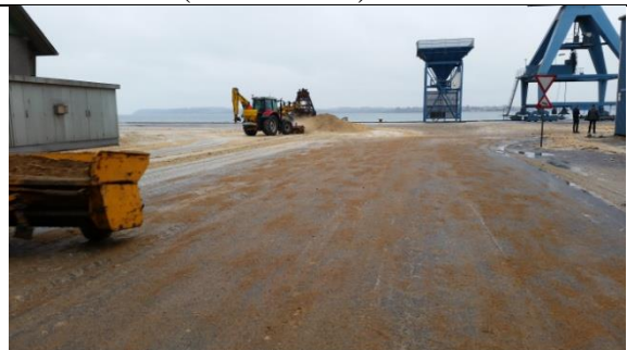
Palmeolie på Oceankajen (5. feb. 2016)