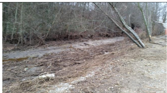
Ubefæstet areal – offentlig sti bag Autohuset Vestergaard. (7. feb 2016)