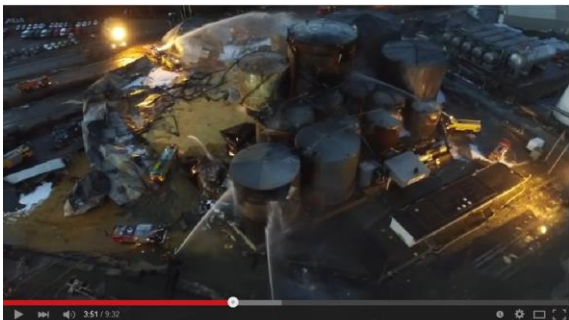
Droner: Brand på Fredericia Havn