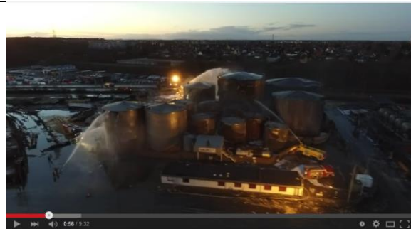
Droner: Brand på Fredericia Havn