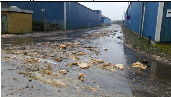
Palmeolie på Slippe 5 (5. feb. 2016)