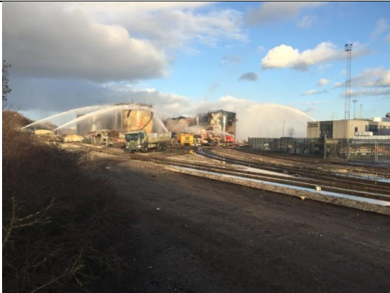
Slukning fra flere sider (4. feb.2016)