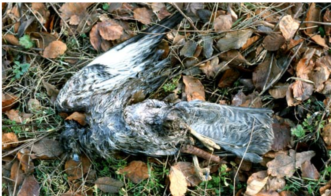
Døde rotter og mus, der har ædt gift, kan give problemer med forgiftning af ugler, rovfugle og mindre rovpattedyr.

Fordele: Sikringsordninger med fælder og indikatorblokke giver færre forgiftninger af rovfugle og rovdyr. Sikringsordninger, der omfatter seriøse bygningsgennemgange, holder effektivt rotter og mus ude.