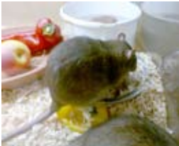
Mus i private boliger og sommerhuse er et velkendt fænomen

I private boliger og sommerhuse vil man forholdsvis let kunne fange mus i smækfælder, da musene ikke har samme mistroiskhed over for fælder som rotter, og da musebestandene sædvanligvis er begrænsede. Smækfælderne er billige og lette at aktivere og kan placeres næsten overalt, hvor musene færdes.