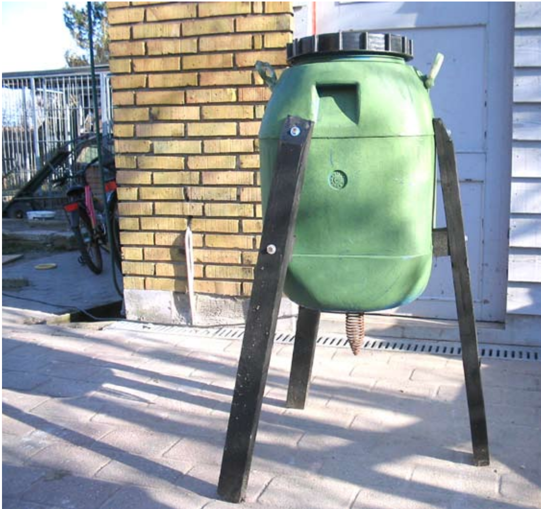
Foderautomat med spiral, der sørger for, at rotter ikke så let har adgang til foderet.