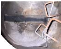
Tætte og vedligeholdte kloakker er den bedste form for rottesikring.

Det vigtigste ved en sikringsordning er imidlertid hverken fælder eller gift men derimod en bygningsgennemgang, der med fokus på fejl og mangler ved bygninger m.v. gør, at rotter og mus ikke trænger ind på virksomhederne.