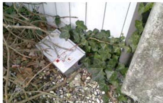
tv. Bekæmpelse af rotter i boliger bør altid foregå uden brug af gift.