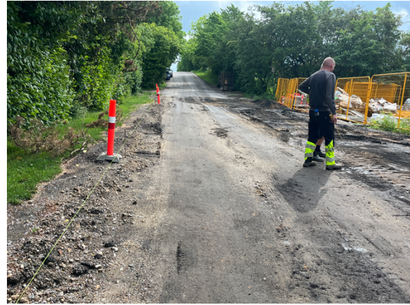
Oprindelig (ikke asfalteret) vej – mod øst