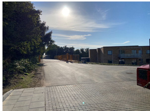
Ny vej – mod øst