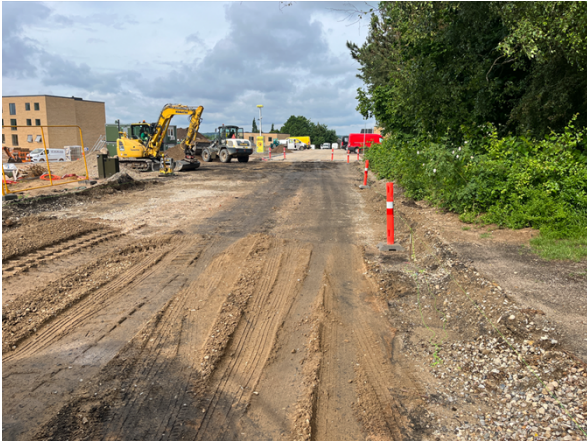
Oprindelig vej – mod vest