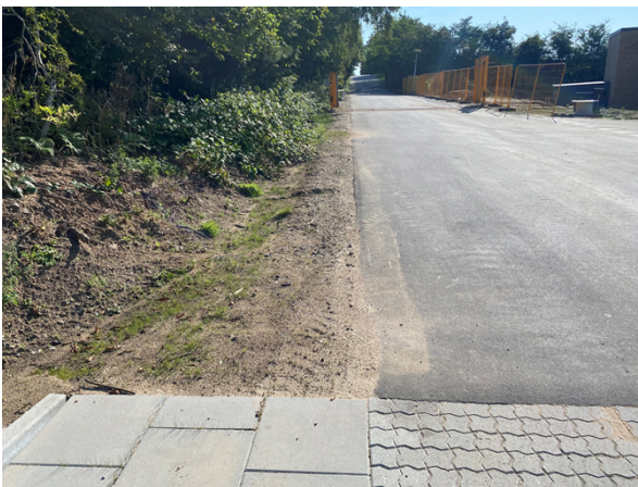
Ny vej – mod øst