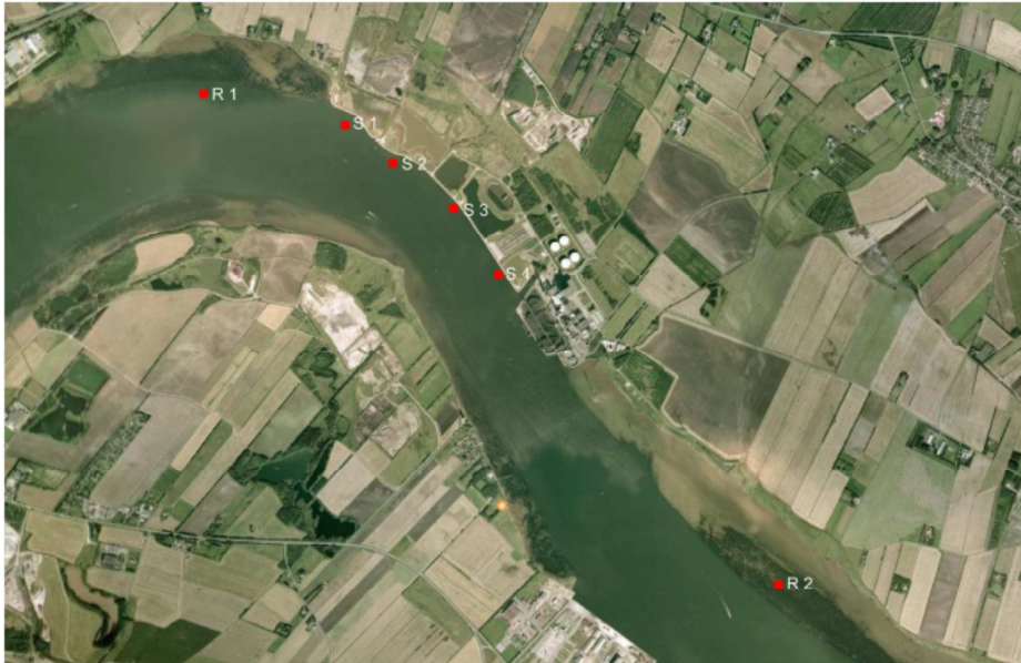
Figur 2.1: Stationer for sediment i Limfjorden

Placering af prøvestationer er angivet på nedenstående kort: