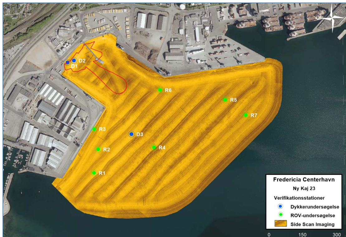
Figur 3: Side scan imaging ekkogram af undersøgelsesområdet med tilhørende undersøgte stationer til verifikation af substrattyper samt undersøgelse af marin flora og fauna.

(Substrattype 2), Figur 4 . Substrattype 1 med siltet bund er kun registreret på ca. 6 ha. (11%) af havbunden inderst i havnebassinet i på dybder over ca. 4 meter.