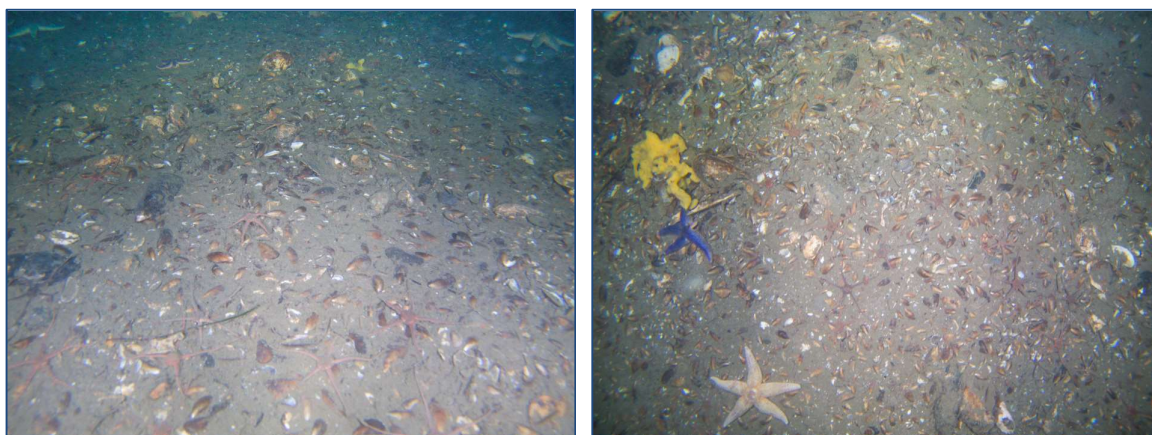
Figur 13: Udvalgte fotos illustrerende substratforhold, flora og fauna på station R6; 16,1 m.

Fauna: Store søstjerner ( Asterias rubens ) og slangestjerner ( Ophiura spp. ) spredt over bunden.