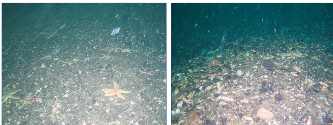
Figur 9: Udvalgte fotos illustrerende substratforhold, flora og fauna på station R2; 13,9 m.

Fauna: Mosdyrkolonier ( Flustra foliacea ), havsvampe ( Halichondria og Haliclona ) sidder fasthæftet på de større sten.