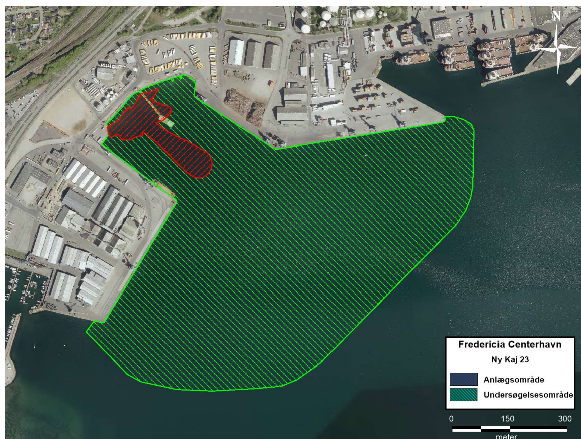
Figur 2: Kort over anlægs- og undersøgelsesområde.

Vanddybden i anlægsområdet er 0 til ca. 14 meter, hvor det dybeste parti er en dybrende midt i havnebassinet, mens der i hele undersøgelsesområdet er dybder ned til ca. 25 meter ud mod Lillebælt jf. Figur 1. I Lillebælt er der generelt kraftige og betydende strømforhold, hvilket også afspejles på de marine forhold herunder sedimentforhold ud for Fredericia Havn.