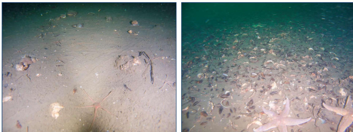
Figur 12: Udvalgte fotos illustrerende substratforhold, flora og fauna på station R5; 20,3 m.

Fauna: Enkelte individer af konksnegle ( Nassarius reticulata ) bevæger sig frit på sedimentoverfladen blandt store søstjerner ( Asterias rubens ) og slangestjerner ( Ophiura spp. ).