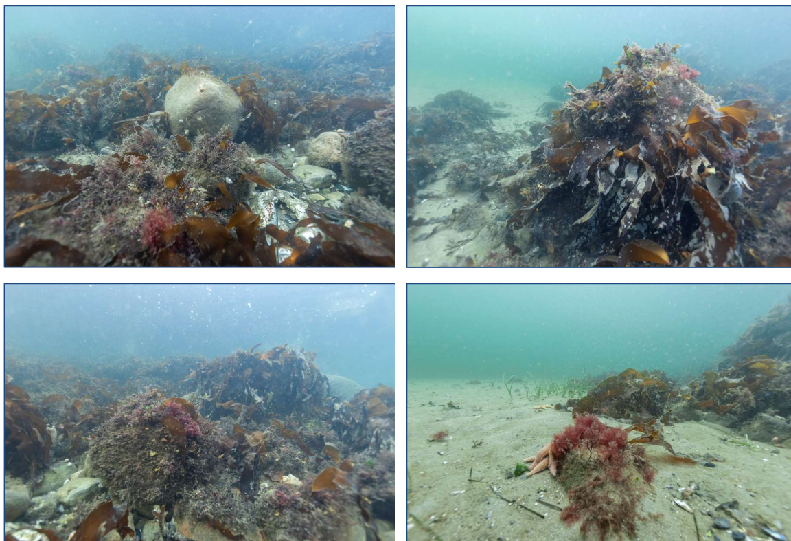
Figur 5: Udvalgte fotos illustrerende substratforhold, flora og fauna på station D1; 2,6 m.

Substrat: Stenmole (huledannende stenrev) til kajsikring med større sten op til 90 cm.