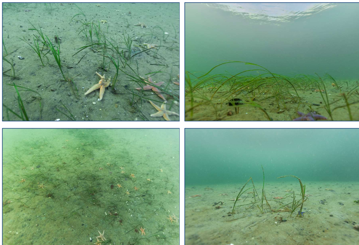
Figur 6: Udvalgte fotos illustrerende substratforhold, flora og fauna på station D2; 2,6-4,3 m.