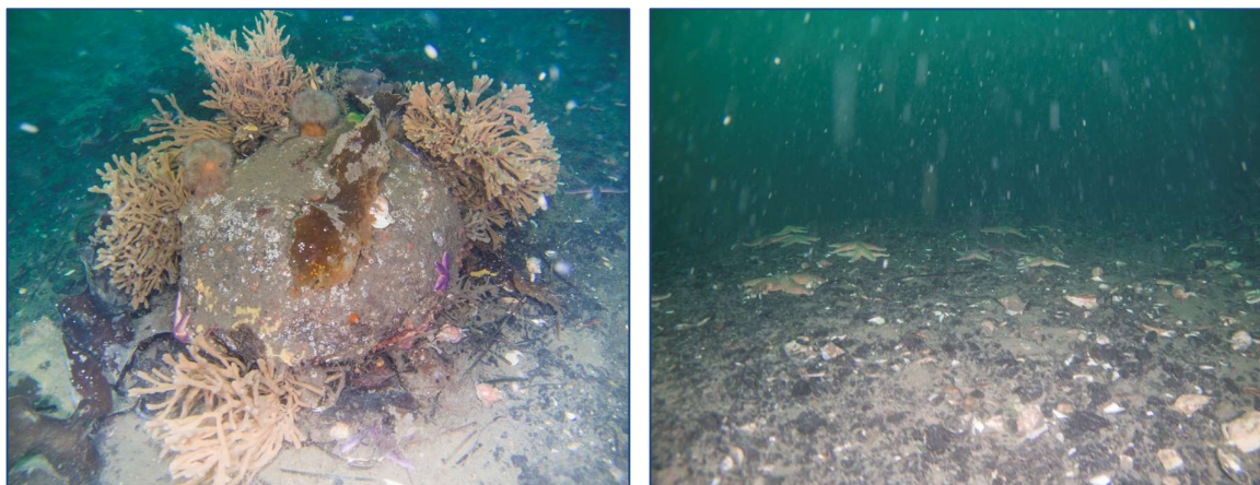
Figur 8: Udvalgte fotos illustrerende substratforhold, flora og fauna på station R1; 14,6 m.

Substrat: Fast bund af siltet grusblandet sand med blåmuslinge-, molbøsters- og gamle østersskaller og en enkelt sten.