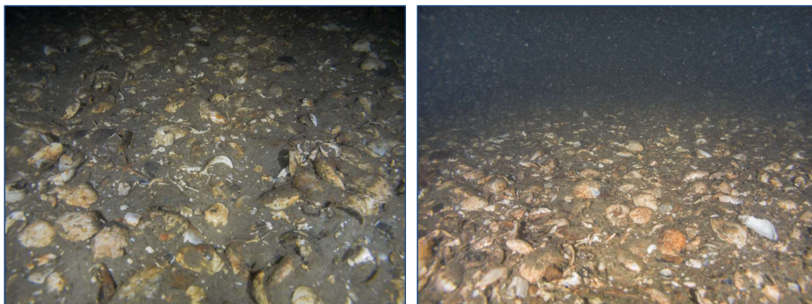
Figur 14: Udvalgte fotos illustrerende substratforhold, flora og fauna på station R7; 21,5 m.

Substrat: Blød sandblandet silt med skaller af sand- og blåmusling samt molboøsters.