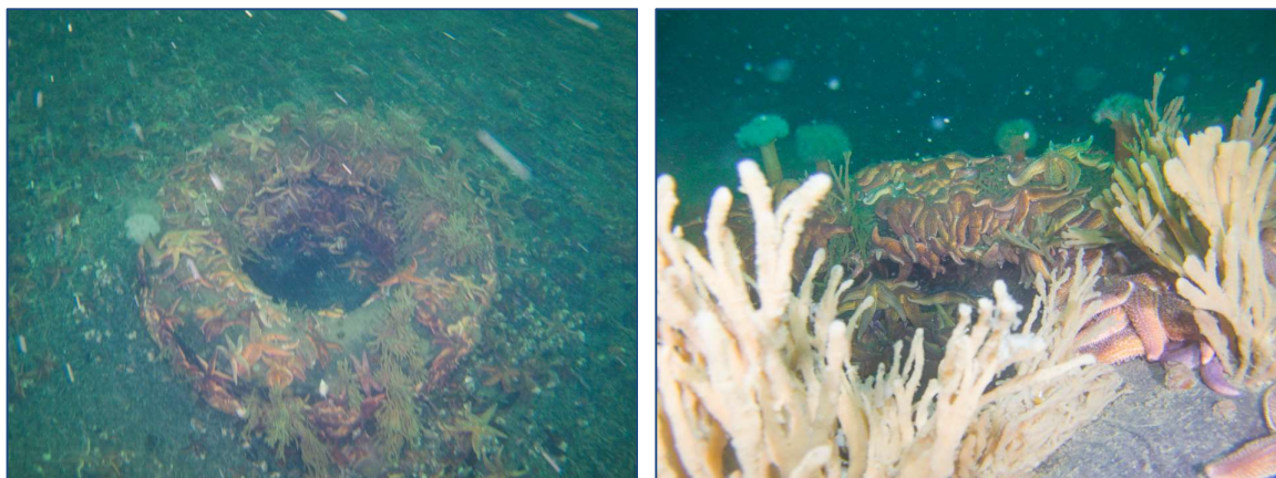
Figur 10: Udvalgte fotos illustrerende substratforhold, flora og fauna på station R3; 12,8 m.

Substrat: siltet grusblandet sand med døde blåmuslingskaller og anomalier i form af tabt gods og bildæk.