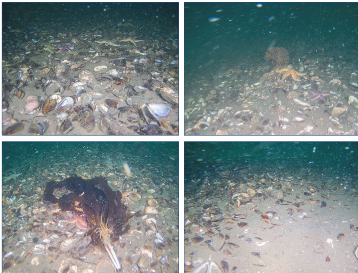
Figur 11: Udvalgte fotos illustrerende substratforhold, flora og fauna på station R4; 18,1 m.

Fauna: Mosdyrkolonier ( Flustra foliacea ), havsvampe ( Halichondria og Haliclona ) og sønelliker ( Metridium senile ) sidder fasthæftet på anomalier. Søstjerner ( Asterias rubens ) forekommer talrigt.