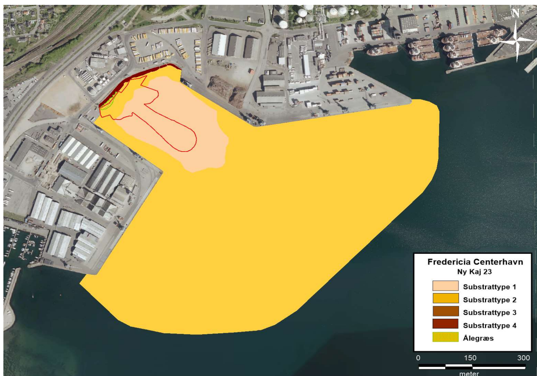
Figur 4: Udbredelse af substrattyper og ålegræs i undersøgelsesområdet.

Naturligt forekommende substrattype 3 og 4 med hårdbund og tættere forekomster af større sten er ikke registreret i undersøgelsesområdet. Dog er der langs den nordvestlige havnekant etableret en mole med store sten til bølgebrydning og kajsikring. Molen danner en form for huledannende stenrev (substrattype 4) fra 0 til 2,6 meters dybde. Dette substrat på mindre end 0,2 ha. (0,4%) af undersøgelsesområdet er dog af kunstig herkomst og vil blive erstattet med spundsvægge i forbindelse med etableringen af Ny Ro/Ro kaj 23.