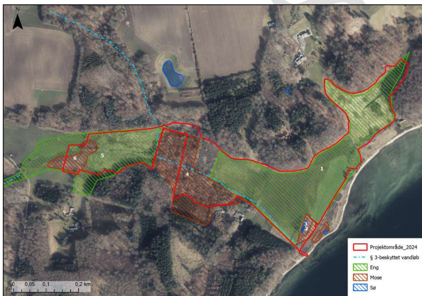
Figur 2: Udpegning af de kortlagte § 3-beskyttede arealer i tilknytning til projektområdet