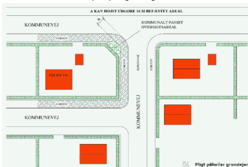
Figur 1, Hjørnegrund grænsende til 3 kommuneveje med fortov. Grundejer kan pålægges pligten på alle sider, da de ligger i ubrudt forlængelse af en adgang til ejendommen.

Se nedenstående eksempler på figur 1 og 2: